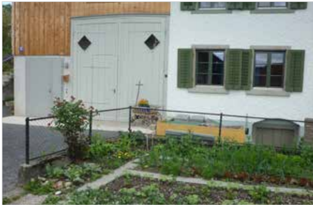
Abb. 5: Umgebautes Bauernhaus mit Gemüsegarten, eingefasst mit einem Eisenzaun, der mit einem Drahtgeflecht bespannt ist

In Kern- und Weilerzonen sind Kleinbauten und Kleintierställe in Absprache mit der Denkmalpflege und nach Erhalt der Baubewilligung gestattet.