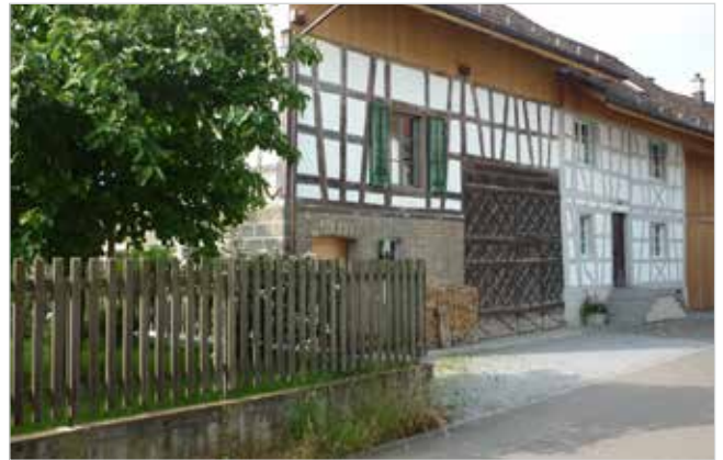
Abb. 6: Umbau eines Bauernhauses mit Vorplatz und eingefasstem Garten in der Kernzone

Bauergärten wurden offen und einsichtbar präsentiert. Wird ein Schutz vor Einblicken gewünscht, ist eine entsprechende Bepflanzung geeignet. Sichtschutzwände sind hingegen unpassend.