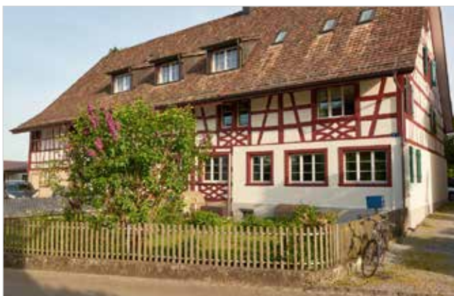
Abb. 3: Bäuerlich geprägtes Kernzonenhaus mit eingezäuntem Garten

Der typische Bauerngarten ist ein nah beim Wohnhaus gelegener, eingezäunter Gemüse-