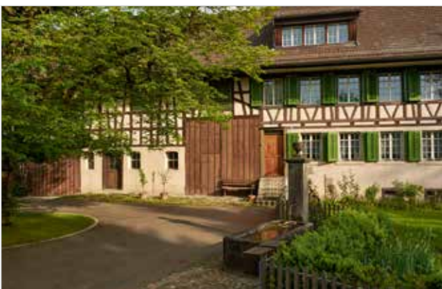
Abb. 1: Bauernhaus mit charakteristischem Vorplatz mit Linde, Brunnen und Bauergarten mit Holzstaketenzaun

Die bauliche Gestaltung des Freiraums in Kern- und Weilerzonen ist gemäss Art. 6 BZO grundsätzlich bewilligungspflichtig. Bauten, Anlagen und Umschwung sind im Ganzen, sowie in einzelnen Teilen so auszugestalten, dass der typische Gebietscharakter gewahrt bleibt und eine gute Gesamtwirkung erzielt wird. Dies gilt auch für die Gestaltung der Umgebung, der Gärten, der Einfriedungen (Zäune) und der Vorplätze (Art. 3 BZO).